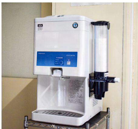
▲ウォーターサーバー