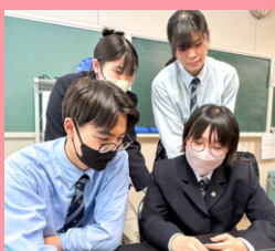
放課後 生徒会活動