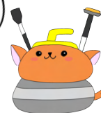
南富高マスコットキャラクター「しかとん」