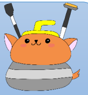
イメージキャラクター 「しかとん」