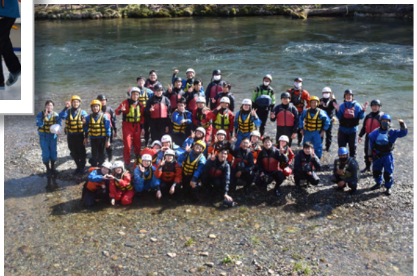
豊かな環境を活かした学び