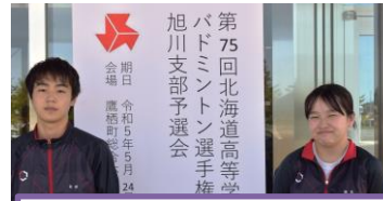
高体連 バドミントン部