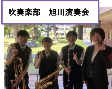
吹奏楽部 旭川演奏会