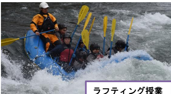
ラフティング授業