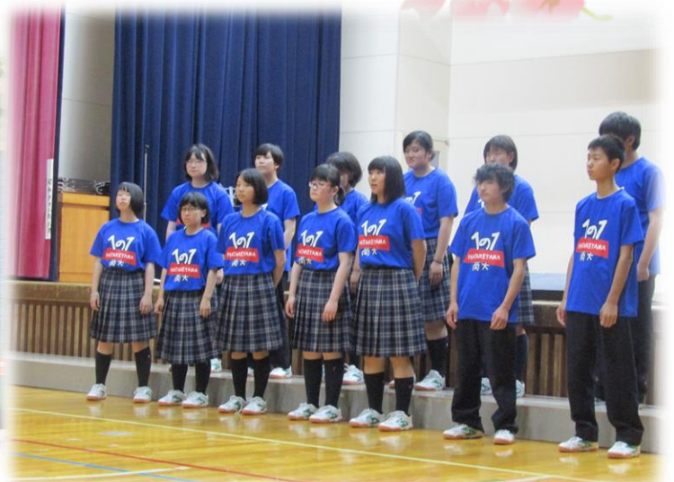
学校祭 合唱コンクール