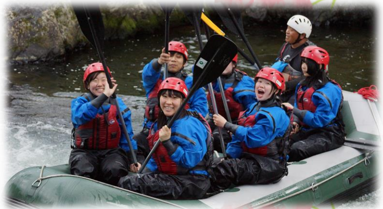
ラフティング授業 スリリングな体験