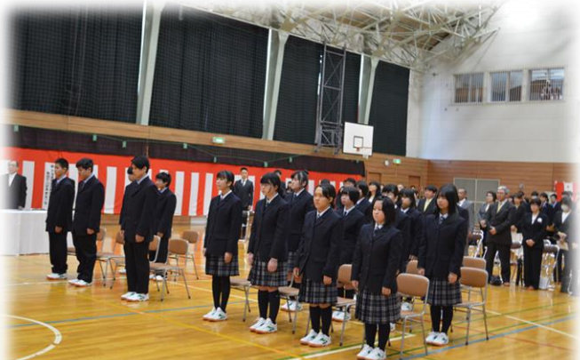
緊張の入学式、みんな初々しい