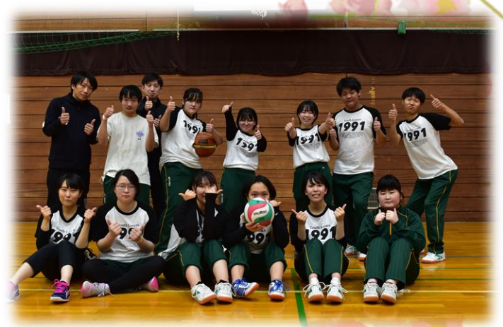
体育大会 学年が一つに