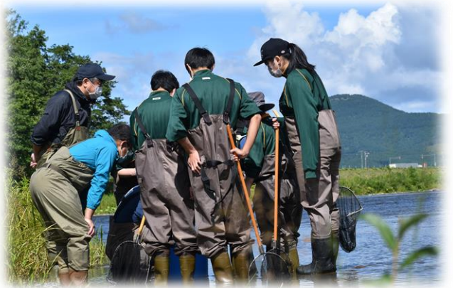
環境学習で水生生物を調べている様子