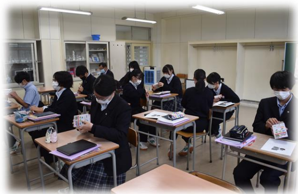
数学の授業の様子