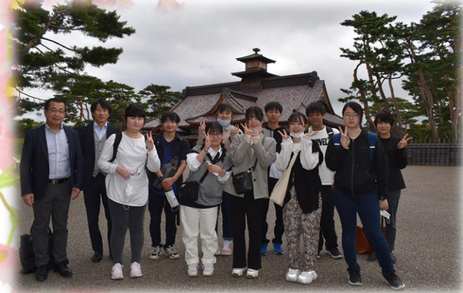
3年研修旅行 五稜郭にて