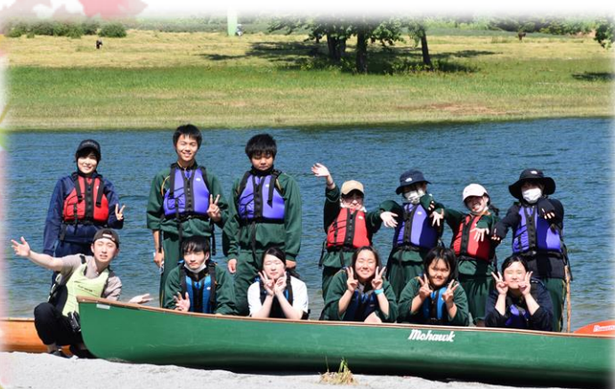
カヌー授業 かなやま湖にて